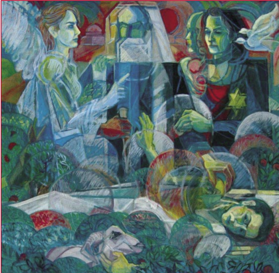
Il sacrificio di Isacco (1991-1996) - cm. 100x100