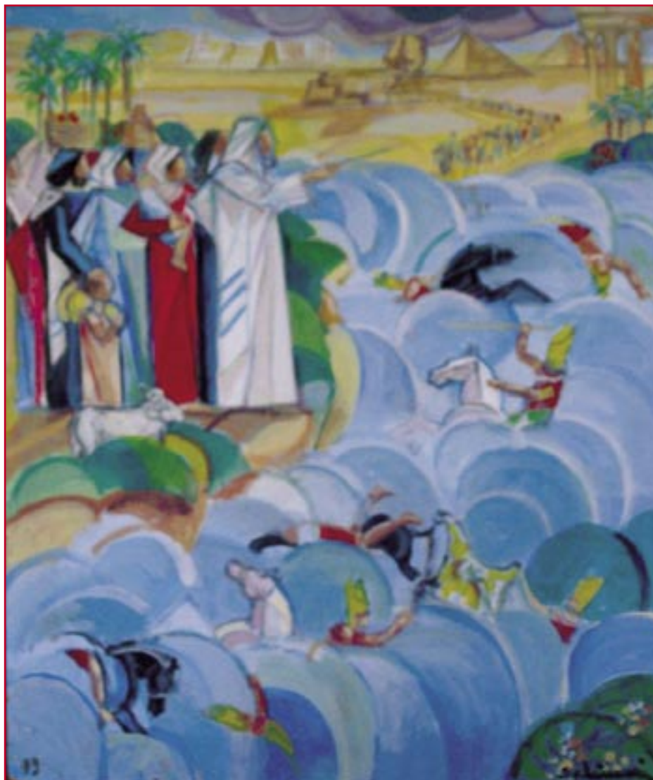
Mosè e il suo popolo libero attraverso il Mar Rosso (1999) - cm. 55x46