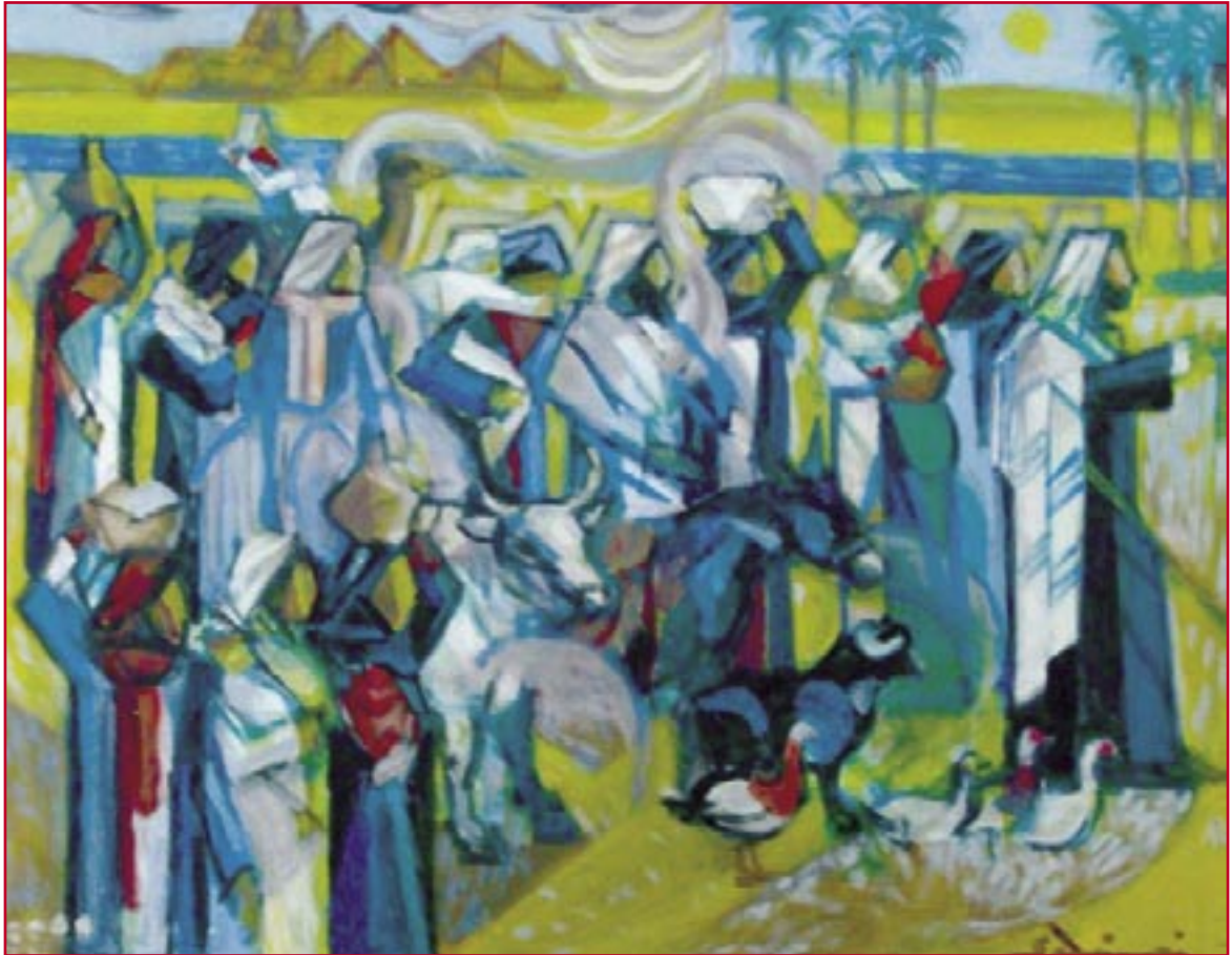
Esodo - Uscita dall'Egitto (2000) - cm. 39,5x49,5