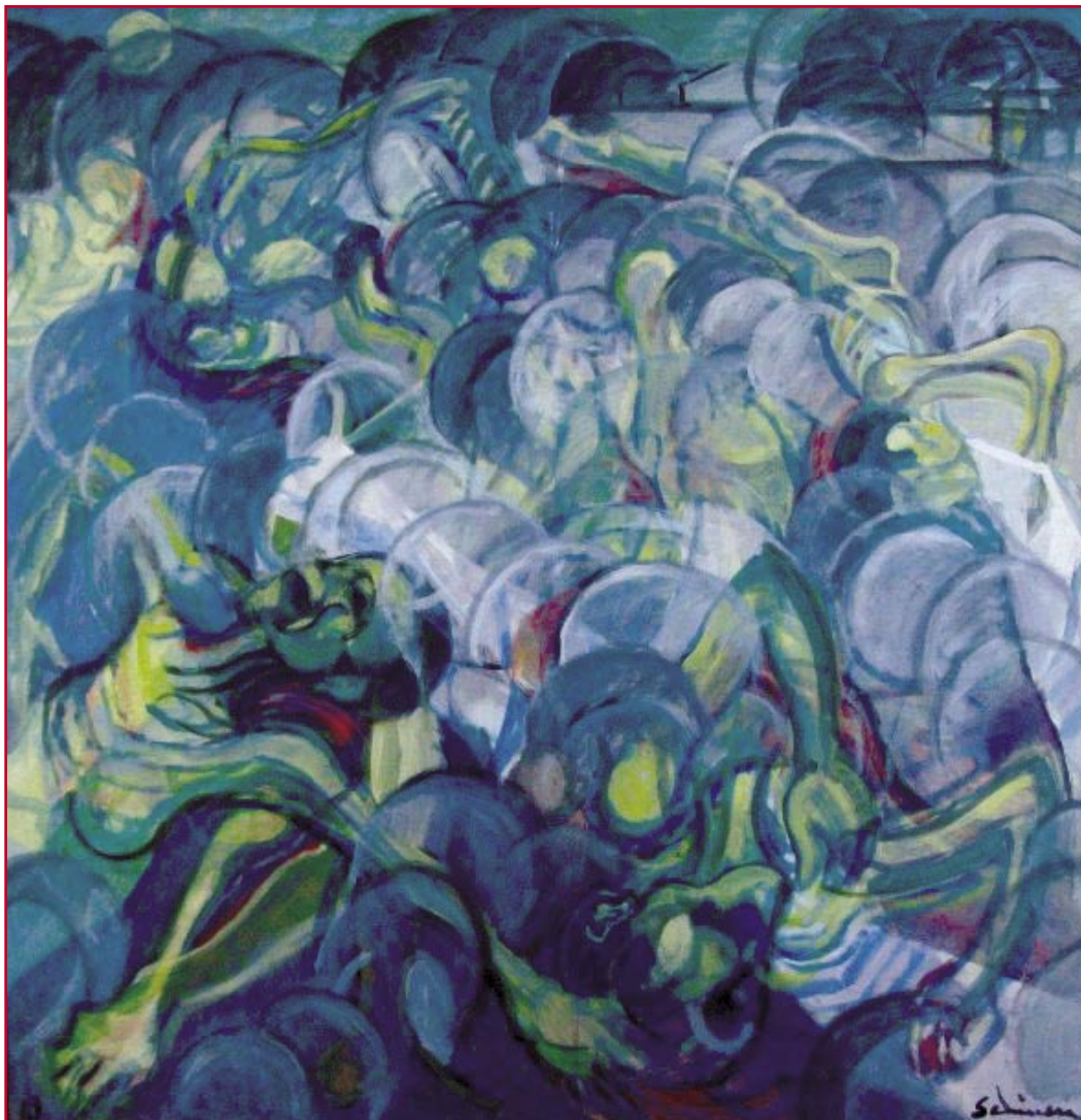
Omaggio ai deportati dei campi di sterminio (1989-1995) - cm. 79x79