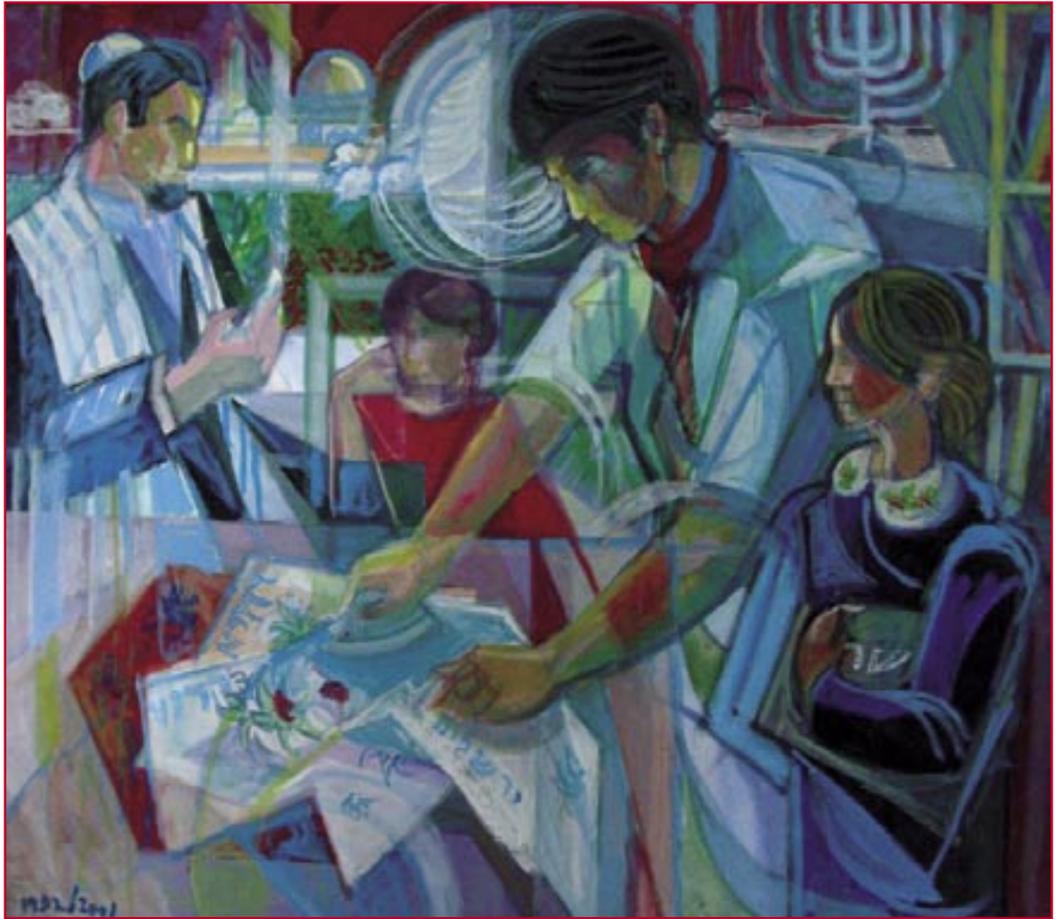
La stiratrice ebrea con la famiglia a Gerusalemme (2001) - cm. 75x85