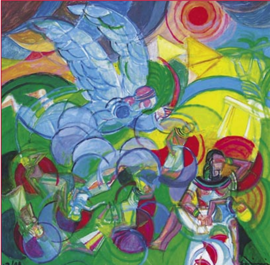
La morte dei primogeniti del Faraone (1999) - cm. 70x70