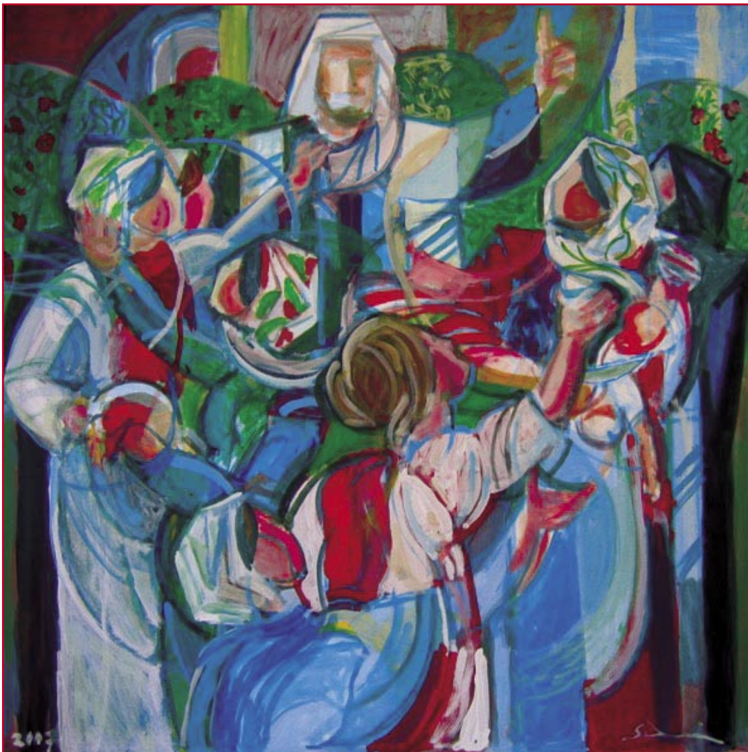
Il giudizio di Salomone (2007) - cm. 80x80