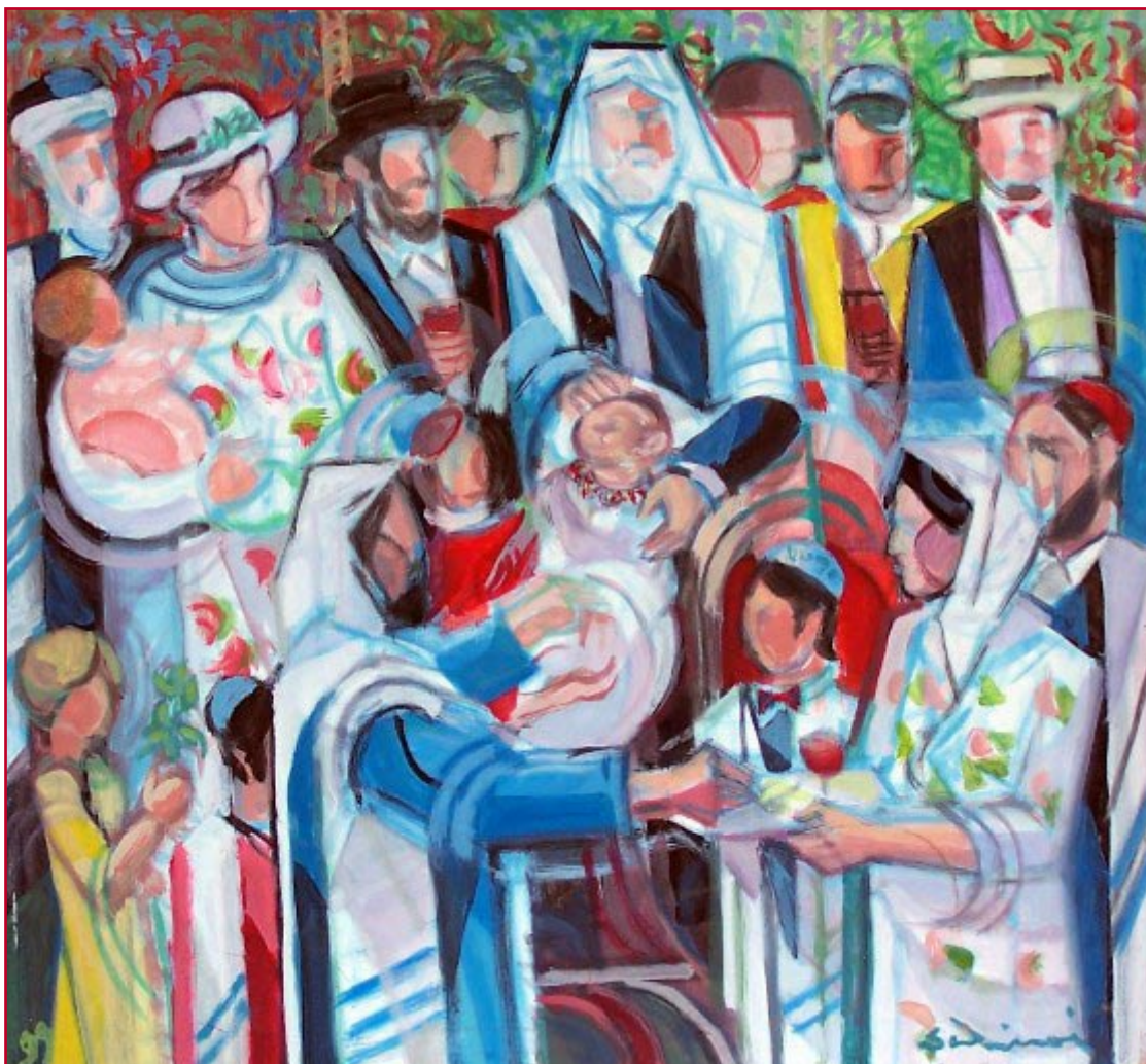
La circoncisione (1999) - cm. 49,5x46