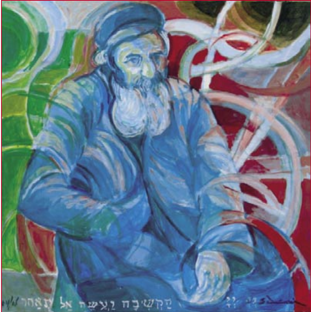
Il facchino del ghetto (2004-2005) - cm. 70x70