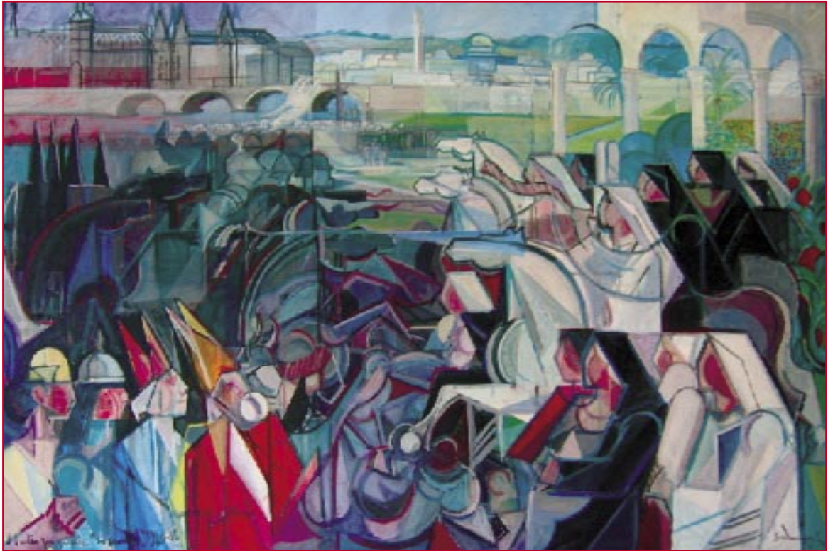
Lotta all'Inquisizione (1986) - cm. 110x170