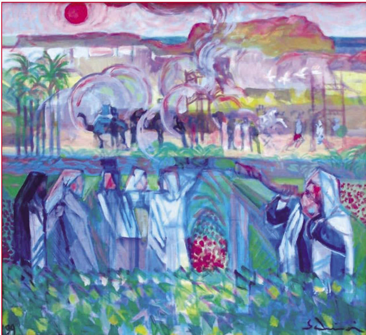
Omaggio alla resistenza a Masada (1999) - cm. 45,6x49,6