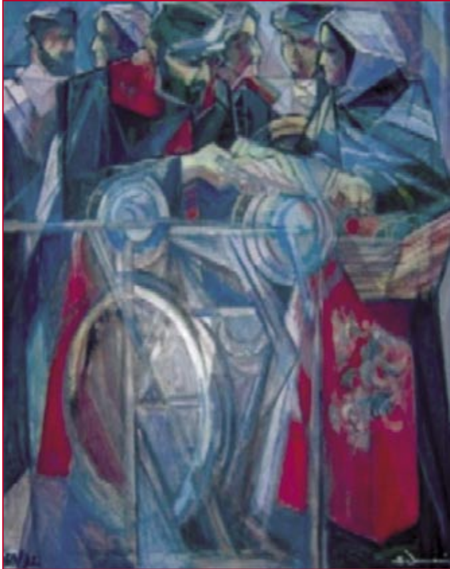
L'arrotino del ghetto (1989-1992) - cm. 100x80