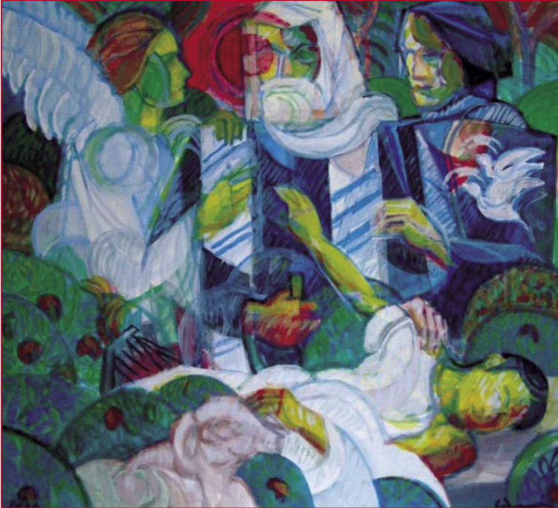
Il sacrificio di Isacco (1998) - cm. 65x70