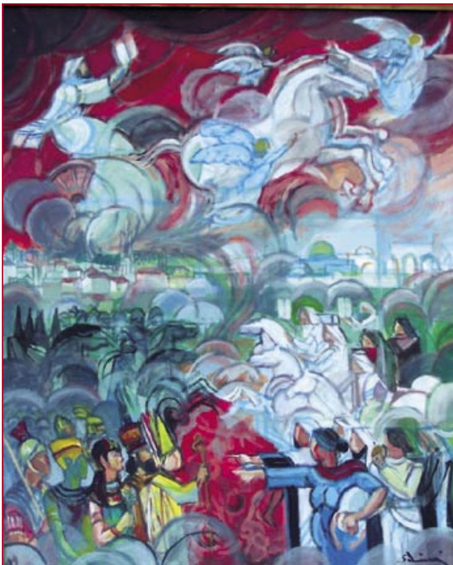
Elia che salva la Torà (1999) - cm. 60x73