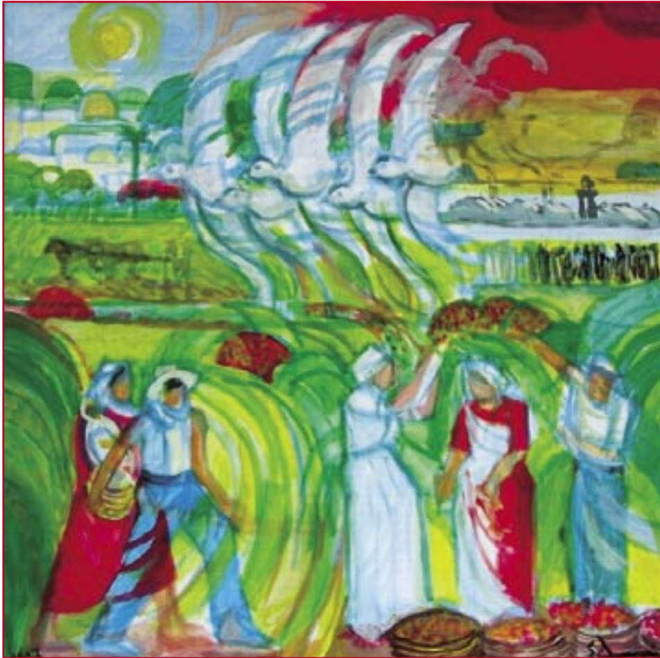
Giubileo d'Israele (1997) - cm. 70x70