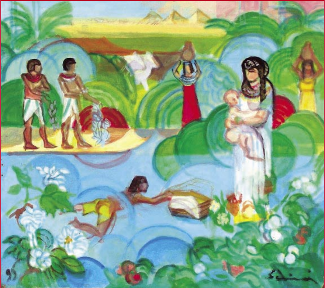
Mosè salvato dalle acque (1996) - cm. 43,8x49,6