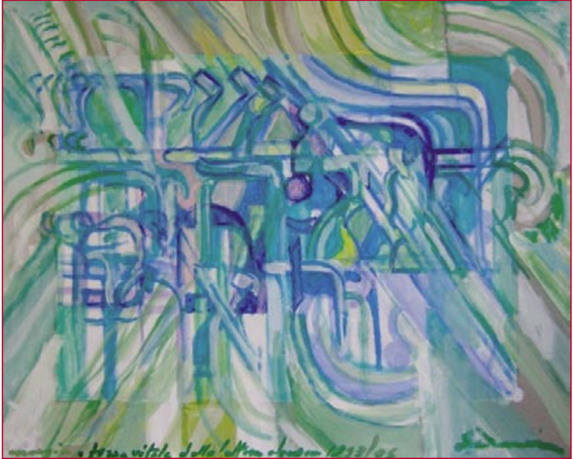
Energia e forza dell'alfabeto ebraico (1993-2003) - cm. 50x60