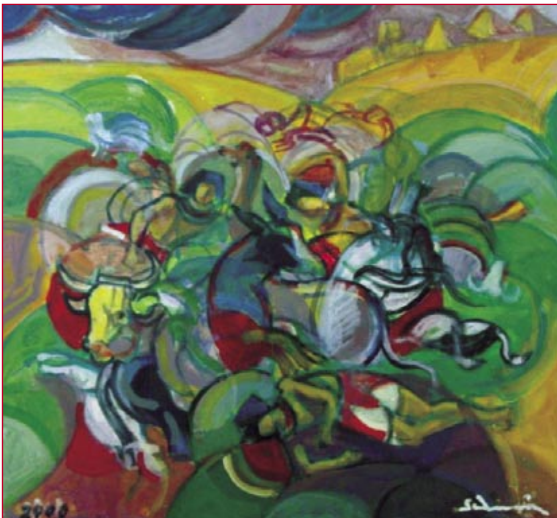
La peste - Le dieci piaghe di Pesach (2000) - cm. 47x51,5