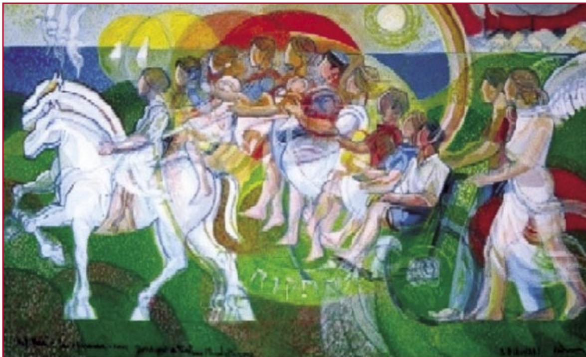
Hatikvâ - La Speranza (2002) - cm. 150x260