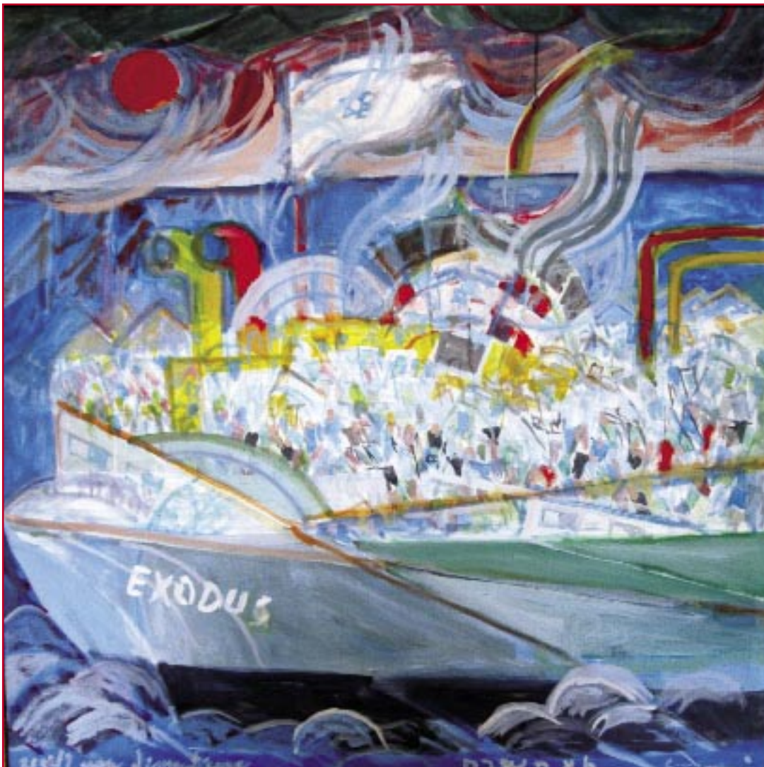
Exodus - Omaggio ai perseguitati (2006-2007) - cm. 80x80