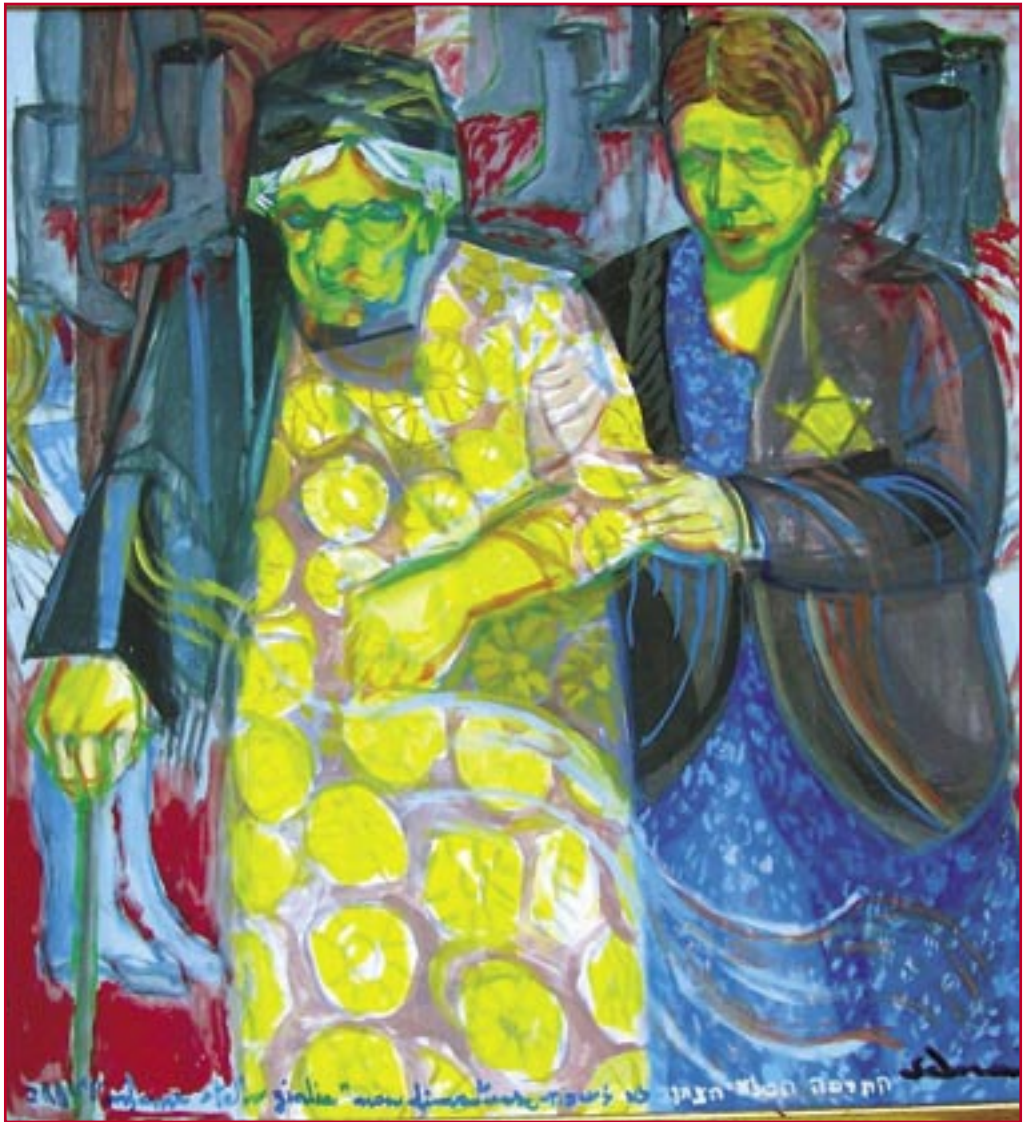
L'infame stella gialla (2001) - cm. 85x90