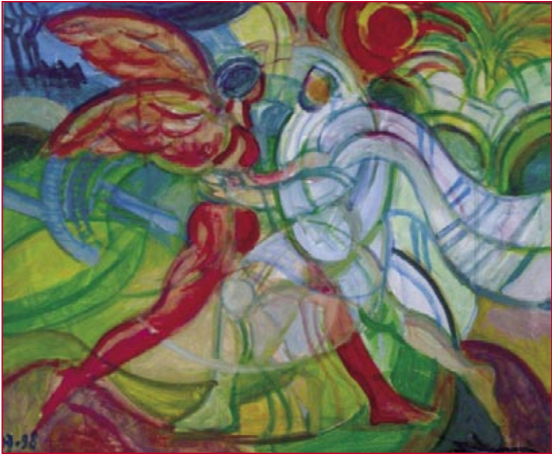
Giacobbe e l'angelo (1997-1998) - cm. 50x60